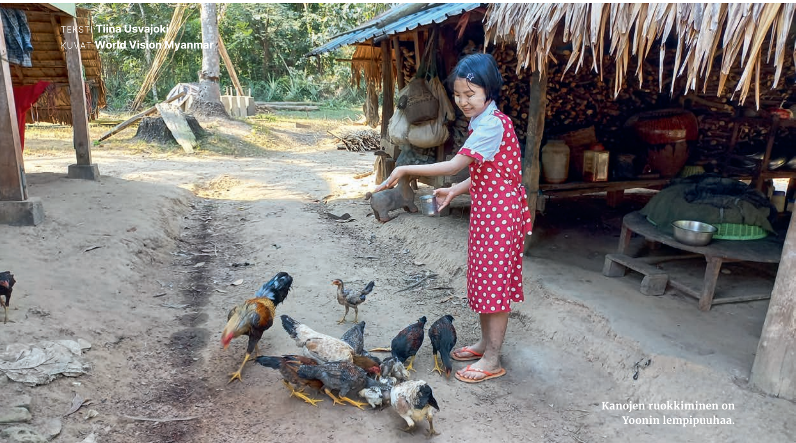
Kanojen ruokkiminen on Yoonin lempipuhuaa.

TEKSTI Tiina Usvajoki KUVAT World Vision Myanmar