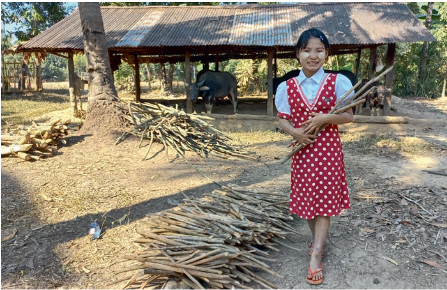
Risujen kerääminen on tärkeä kotityö.