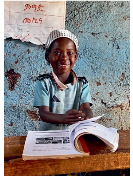
Yhä useampi lapsi pääsee kouluun Etiopiassa.

Yhteisön jäsenet ovat estäneet 11 lapsiavioliittoa, ja viisi koulunsa keskeyttänyttä tyttöä on palannut takaisin opiskelemaan. Muutostyöhön on osallistettu myös lapsia. He ovat päässeet