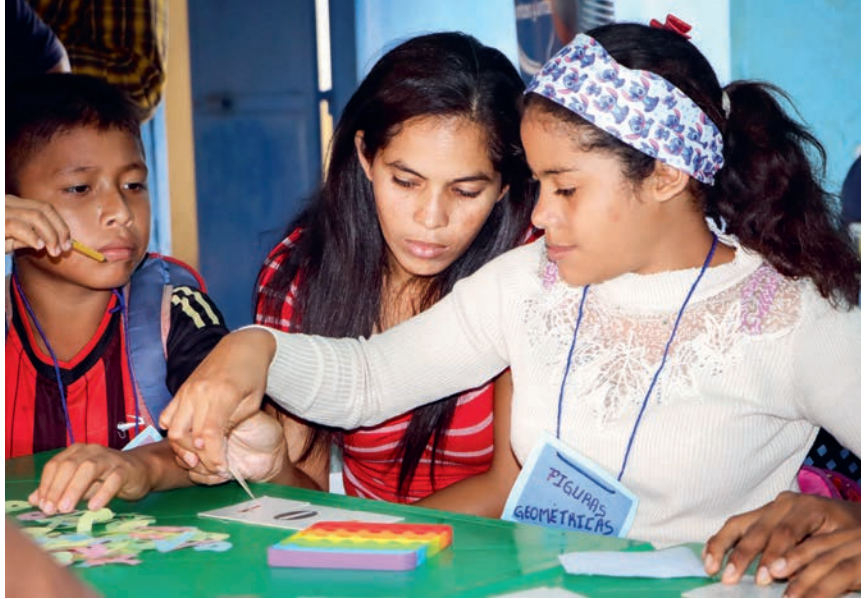
TEKSTI Heidi Honkajuuri

Myös Lalogi-Lakwanassa kehitys on ollut myönteistä. Jo 12 koululla on valmiit suunnitelmat ja sitoutunut henkilökunta kouluruokailun edistämiseksi. Viime vuonna neljä koulua tarjosi koulupäivän aikana lounaan yhteensä yli 4 600 oppilaalle. ●